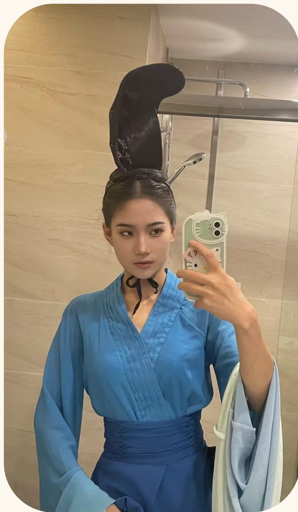
南山竹海舞蹈演员