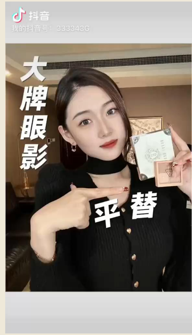
Bobbi Brown 高光盘